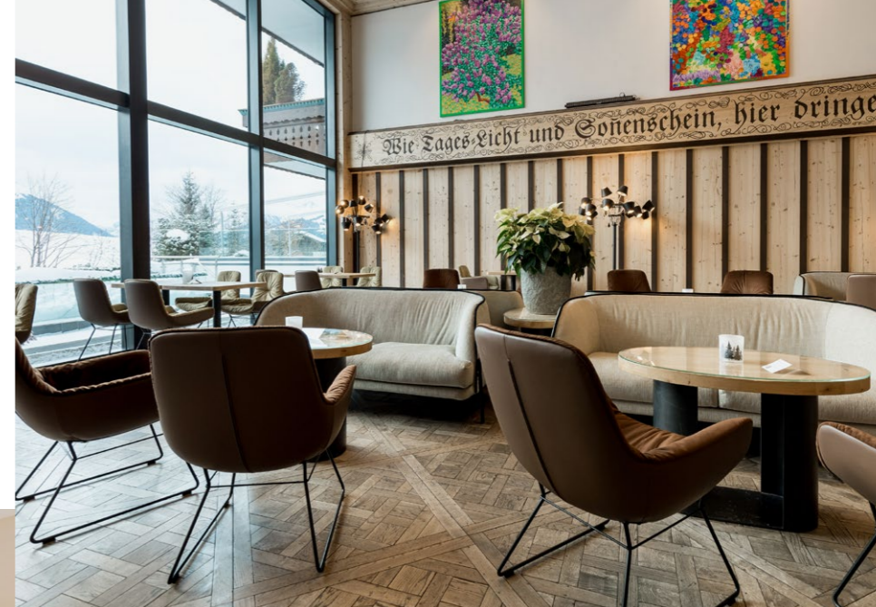
Hall panoramique «Bärgblick»